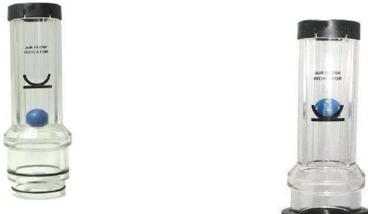
Минимальный уровень потока воздуха